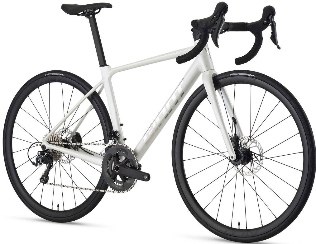
COLOR: クリスタルホワイテスブラッター

GIANTを代表するトータルレースバイク「TCR」のDNAを、アルミニウムフレームに凝縮したプレミアムアルミロード「TCR SLR」が新登場。フレームには最上級のアルミ素材と、GIANTが誇る最先端のアルミニウムフレーム製造テクノロジーを惜しみなく投入し、カーボンバイクに迫る軽さと剛性、鋭い走行性能を実現。TCR ADVANCEDグレードと共通のフルカーボンフォークは、左右対称のデザインで、軽量性と剛性、空力性をバランス。日々のサイクリングはもちろん、レースやロングライドまで幅広いライダーの期待に応える一台。