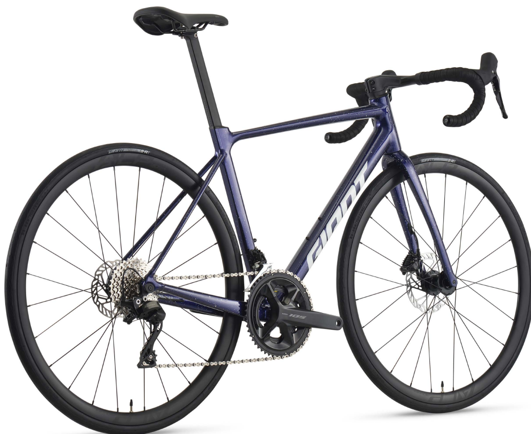
COLOR: アズライトブルースプラッター

GIANTを代表するトータルレースバイク「TCR」のDNAを、アルミニウムフレームに凝縮したプレミアムアルミロード「TCR SLR」が新登場。フレームには最上級のアルミ素材と、GIANTが誇る最先端のアルミニウムフレーム製造テクノロジーを組み合わせることでカーボンバイクに迫る軽さと剛性、鋭い走行性能を実現。さらにコックピットには、レースバイクとしてのパフォーマンスをさらに引き上げるフルカーボンワンピースハンドルバーを採用し、優れたエアロ性能と高い剛性を両立。