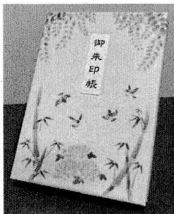
① 遠諱記念御朱印帳