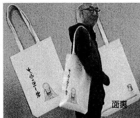
③ 遠諱限定トートバック